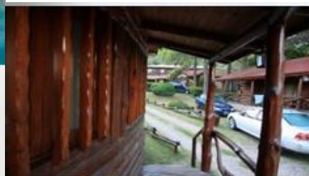
Estacionamiento en el predio

Ubicada en el centro del parque de con palmeras, nuestra piscina posee cerco perimetral.